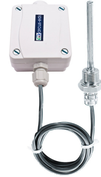
SK01-T-ESTF mit Einschraubfühler / Tauchhülse Fühlerlänge: 50 / 100 mm 1,5m ( PVC / Silikon )