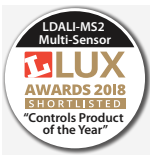
Montagehoogte / bereik LDALI-MS2-BT