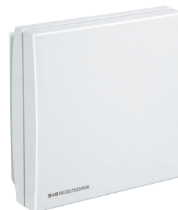
RH-2 met interne instelling